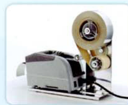
ZCUT-9GRRP リケイ紙を剥離しながらカット