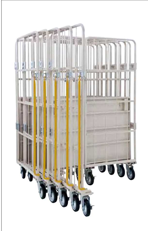
保管時には簡単に折りたため、スペースを取りません。 (注) 折りたたんだ状態での移動は転倒の恐れがあります。