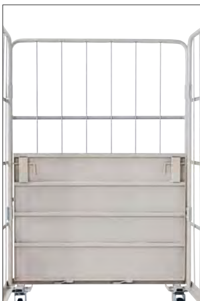
抜群の強度と軽量化を実現。 底板の跳ね上げ作業の省力化。

従来のホーミング加工による強度を保持し、さらにフレーム各コーナー部を折り曲げた事により作業者の安全性にも配慮しています。